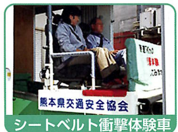
シートベルト衝撃体験車