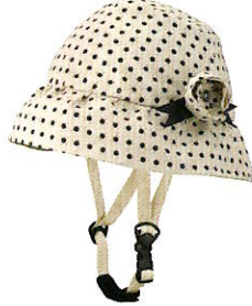
品番C621: ¥7,600税抜き (ヘルメット・帽子セット価格) 品番C321: ¥3,800税抜き (帽子のみ) SIZE: S M