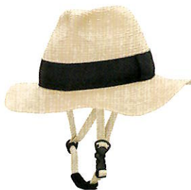
品番C810: ¥6,800税抜き (ヘルメット・帽子セット価格) 品番C410: ¥3,200税抜き (帽子のみ) SIZE: M