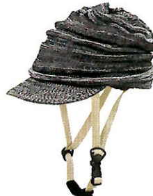
品番C840: ¥6,800税抜き (ヘルメット・帽子セット価格) 品番C440: ¥3,200税抜き (帽子のみ) SIZE: S M L