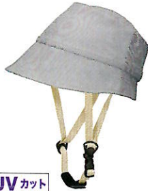
UVカット 品番C624: ¥7,600税抜き (ヘルメット・帽子セット価格) 品番C324: ¥3,800税抜き (帽子のみ) SIZE: S M