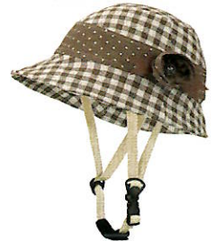
品番C622: ¥7,600税抜き (ヘルメット・帽子セット価格) 品番C322: ¥3,800税抜き (帽子のみ) SIZE: S M L