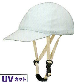
UVカット 品番C634: ¥7,200税抜き (ヘルメット・帽子セット価格) 品番C334: ¥3,500税抜き (帽子のみ) SIZE: S M