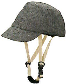
品番C605: ¥7,200税抜き (ヘルメット・帽子セット価格) 品番C305: ¥3,500税抜き (帽子のみ) SIZE: S M L