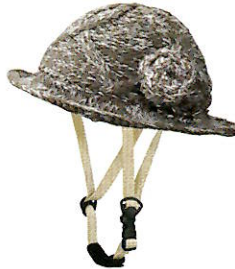
品番C612: ¥7,600税抜き (ヘルメット・帽子セット価格) 品番C312: ¥3,800税抜き (帽子のみ) SIZE: S M