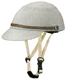
品番C631: ¥7,200税抜き (ヘルメット・帽子セット価格) 品番C331: ¥3,500税抜き (帽子のみ) SIZE: S M