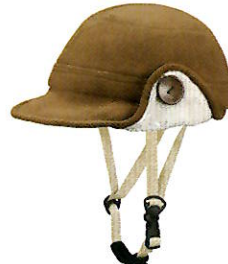
品番C641: ¥7,600税抜き (ヘルメット・帽子セット価格) 品番C341: ¥3,800税抜き (帽子のみ) SIZE: S M