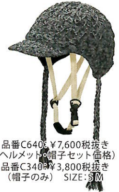
品番C640: ¥7,600税抜き (ヘルメット・帽子セット価格) 品番C340: ¥3,800税抜き (帽子のみ) SIZE: S M