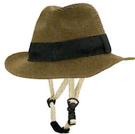
品番C810: ¥6,800税抜き (ヘルメット・帽子セット価格) 品番C410: ¥3,200税抜き (帽子のみ) SIZE: M