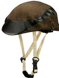
品番C642: ¥7,600税抜き (ヘルメット・帽子セット価格) 品番C342: ¥3,800税抜き (帽子のみ) SIZE: S M