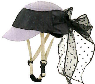
品番C620: ¥7,600税抜き (ヘルメット・帽子セット価格) 品番C320: ¥3,800税抜き (帽子のみ) SIZE: S M