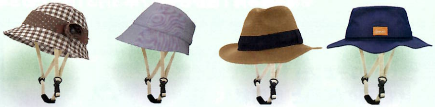
【着せ替え帽子付き自転車用ヘルメット「カポル」】