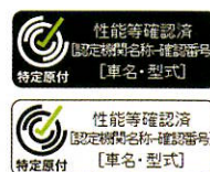
(例) 性能等確認済シール

道路運送車両の 保安基準に適合 した車両でなければ、道路を運転することはできません。