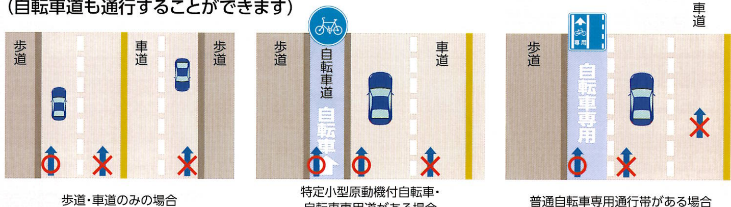
歩道・車道の場合