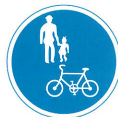
「普通自転車等及び歩行者等専用」標識