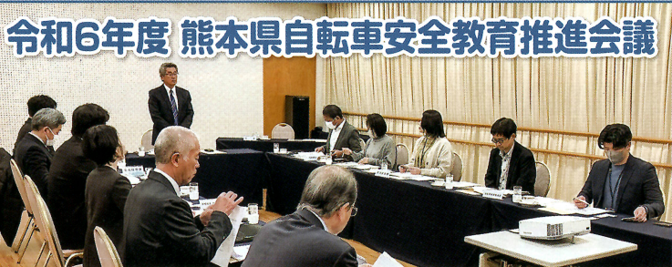
令和7年2月7日、ホテル熊本テルサにおいて、「令和6年度熊本県自転車安全教育推進会議」を開催しました。この会議では、日頃、自転車安全教育に対して様々な活動を実施している熊本県、熊本市、県警、自転車商組合等の各担当者に出席していただき、令和6年度の実績結果や令和7年度の実績予定等について、報告、意見交換、情報共有を行いました。

この文章は、交通事故の加害者として交通刑務所に入所されている受刑者の手記です。熊本県では、令和7年4月1日から「横断歩道止まって渡す」思いやり「キャンペン」運動が継続されます。車を運転される方は、「横断歩道では歩行者優先」との意識を肝に銘じ、信号機のない横断歩道での横断歩行者の交通事故防止に気をつけてください。また、歩行者の方も、道路を横断する時は、携帯電話やイヤホンを使用しながら渡すことはせず、左右の安全を確認して横断しましょう。(編集者)