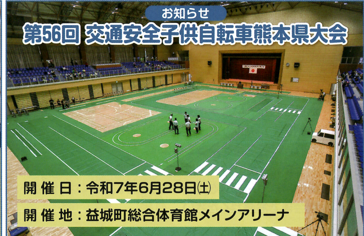
お知らせ 第56回 交通安全子供自転車熊本県大会 開催日：令和7年6月28日(土) 開催地：益城町総合体育館メインアリーナ