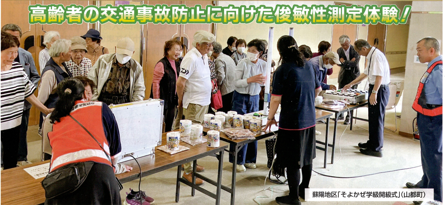
蘇陽地区「そよかぜ学級開級式」(山都町)